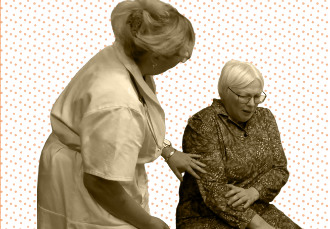
Ηθοποιοί από το LendTeater